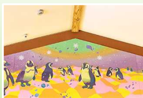
ペンギン(さくらす所蔵)

施設を取り巻く豊かな自然と数々のアート(壁画)は住む方、働く方の癒しをいざない“ Aging in place ” (住み慣れた故郷で 自分らしく最期まで) を実現します。