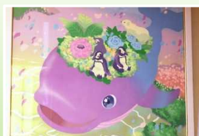
花くじらと仲間たち (グランヒルズ阿見所蔵)