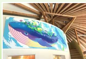
花くじら (花くじら保育園所蔵)