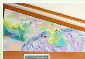
シロクマ